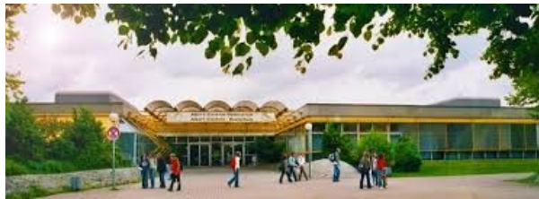
Collège-Lycée Albert Einstein

« J'ai séjourné dans la ville d' Ulm . J'avais un correspondant, Michael, du même âge que moi . J'allais au collège tous les jours mais nous n'étions pas dans la même classe. Malgré mes connaissances acquises en cours d'allemand, il m'était au début difficile de percevoir les subtilités de la langue. Mais au fur et à mesure, je communiquais moins par gestes ou en ayant recours à l'anglais. Et en à peine deux mois, je comprenais une bonne partie des cours, tout ce qu'on me disait et parvenais à faire des phrases de plus en plus complexes. Je me suis même surpris à rêver en allemand !