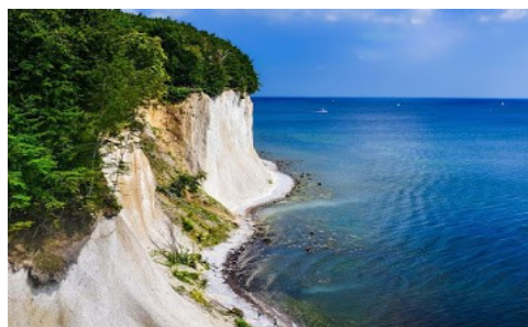
île de Rügen